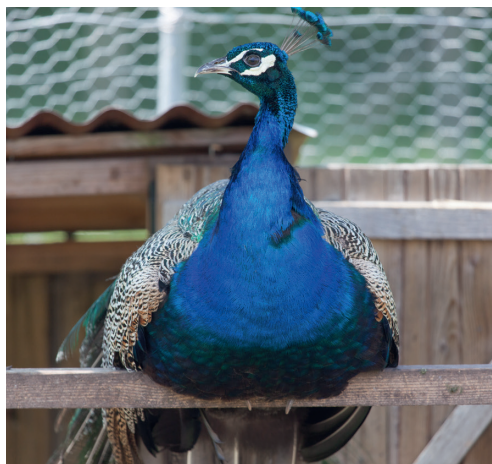
Ferme de la Barbanne

Durée : 1h30 environ - Réservations au 07.77.28.42.86 ou par courriel : ferme-barbanne@mairie-libourne.fr