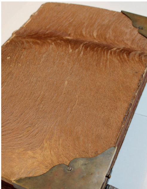
@AM-Lib-Cartulaire municipal, couverture - AA 1

Sur inscription jusqu'au 18 septembre à l'adresse vmeynard@libourne.fr - Jauge limitée